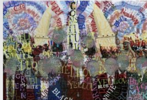
ชื่อผลงาน: ดินแดนสีรุ้งหลากสี Name : Rainbow Nation เทคนิค : Photomontage/spray paint ขนาด : 420 x 594 มม.

วันที่ ๔-๓๑ สิงหาคม ๒๕๖๖ ณ ห้องประชุมครุพัฒน์ คณะครุศาสตร์ หอศิลป์ศรีวิชัย คณะมนุษยศาสตร์และสังคมศาสตร์ มหาวิทยาลัยราชภัฏสุราษฎร์ธานี