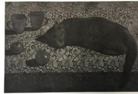
ชื่อผลงาน: The Space of Memory No.3 Name: The Space of Memory No.3 เทคนิค: Etching ขนาด: 60x40 เซนติเมตร