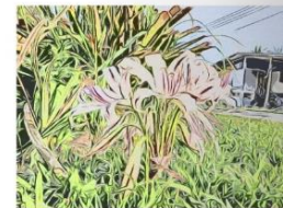
ชื่อผลงาน: หลับฝันผลิบาน เทคนิค : Monoprint + Woodcut prints ขนาด : 30 x 40 เซนติเมตร